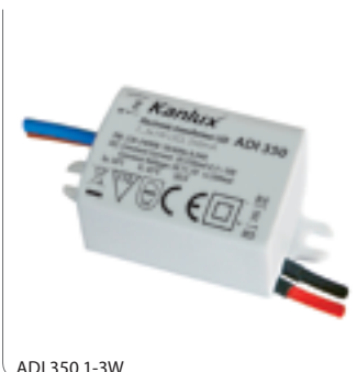
ADI 350 1-3W

Zasilacz elektroniczny LED / Electronic LED transformer