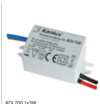
ADI 700 1x3W