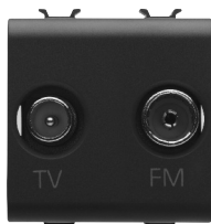
n° 2 mod.