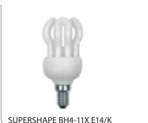
SUPERSHAPE BH4-11X E14/K