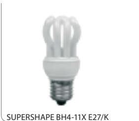
SUPERSHAPE BH4-11X E27/K