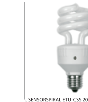
SENSORSPIRAL ETU-CSS 20W E27/K