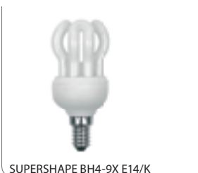
SUPERSHAPE BH4-9X E14/K

Świetlówka kompaktowa / Compact fluorescent lamp