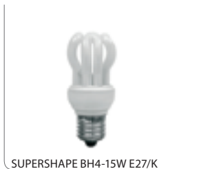
SUPERSHAPE BH4-15W E27/K