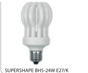
SUPERSHAPE BH5-24W E27/K