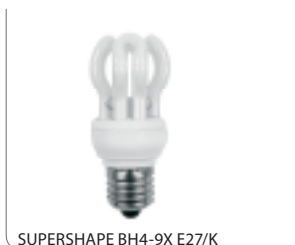
SUPERSHAPE BH4-9X E27/K