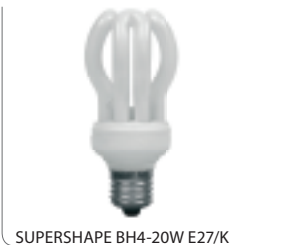
SUPERSHAPE BH4-20W E27/K