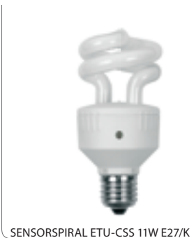
SENSORSPIRAL ETU-CSS 11W E27/K

Świetlówka kompaktowa / Compact fluorescent lamp